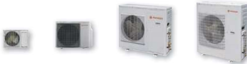
Технические характеристики на наружные блоки