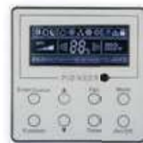
Проводной пульт ДУ в комплекте