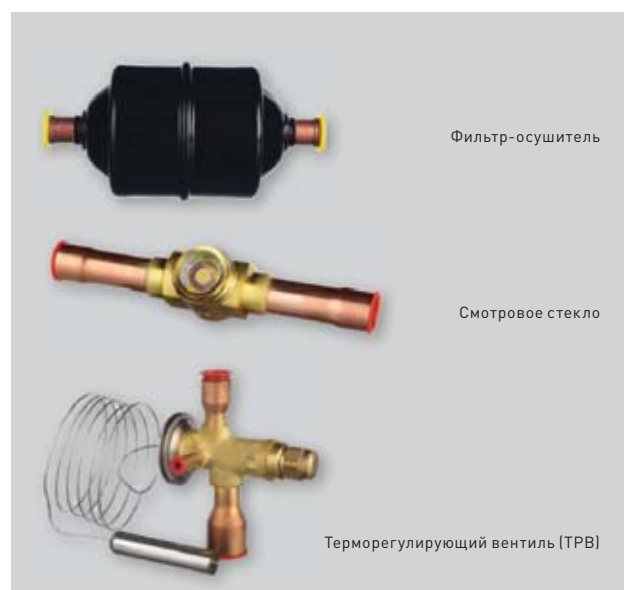
Технические характеристики серии KFDH (R410A)

У наших клиентов есть возможность приобрести комплект из смотрового стекла, фильтра-осушителя и ТРВ (терморегулирующего вентиля), специально подобранных для нашего оборудования. Этот комплект помогает создать экономичный аналог ККБ (компрессорно-конденсаторного блока) из наружного блока высоконапорного кондиционера Pioneer. Такое решение значительно снижает стоимость проекта (по сравнению с решением на ККБ) и позволяет избежать увеличения времени на поиск и подбор комплектующих.